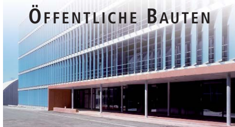
EAWAG / EMPA, Dübendorf